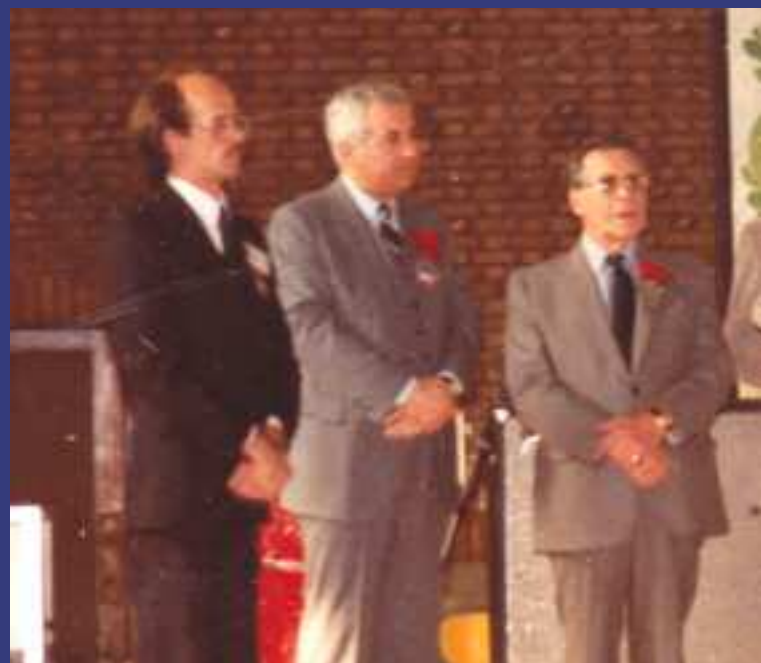
1985 - Kermesse gastronomique

L'organisme se stabilise, définit ses actions et activités récurrentes annuelles et périodiques, détermine les responsabilités du conseil d'administration et celles de l'équipe permanente. Il devient aussi lieu