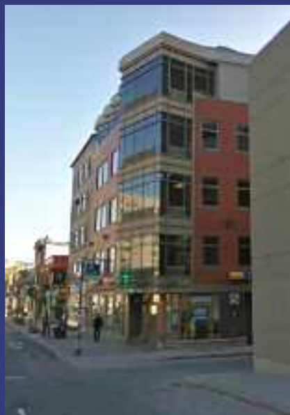
Le CMQ rue de la Couronne

Le CMQ quitte les locaux dans lesquels il est depuis 20 ans, rue Père Marquette, pour s'installer rue de la Couronne. Les partenariats avec de nombreux organismes de la région qui ont commencé à voir le jour dans les années 90 se développent et se précisent. Différents programmes sociaux, culturels et sportifs sont mis sur pied dans des domaines touchant sa mission, dont, notamment, le logement, les écoles et les garderies.