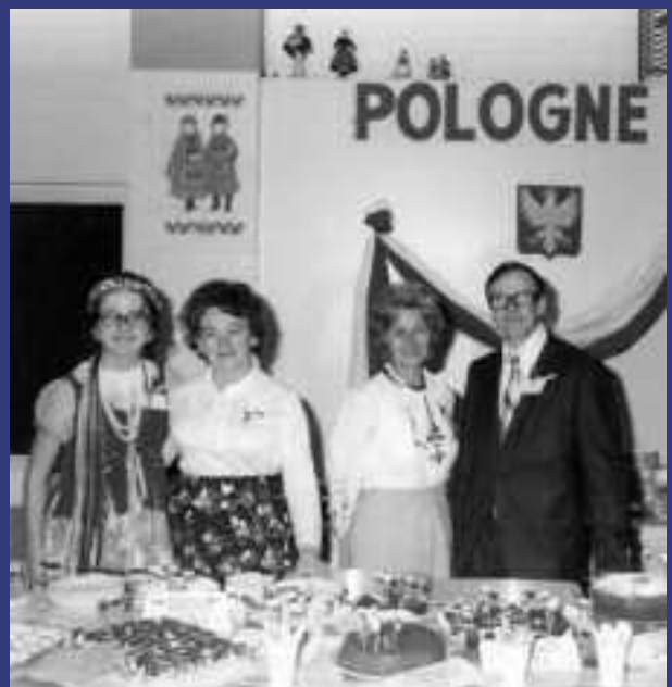
1974 – Kermesse gastronomique

Les réfugiés du Sud-est asiatique sont si nombreux et ont tant de besoins, à la fin de la décennie, que plusieurs régions de l'est du Québec viennent au secours de l'organisme en envoyant des vivres, meubles et vêtements qui occuperont tout un étage du Palais Montcalm.