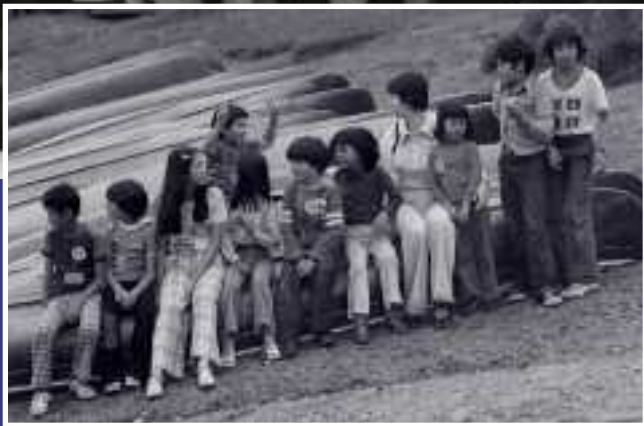
Enfants réfugiés – Base de plein air

sionnalise son intervention en faisant appel à des employés rémunérés et confirme l'apport des bénévoles en tant que dimension essentielle de sa structure. Il continue, par ailleurs, à organiser des activités socioculturelles, aidé par le Québec. Les fonds recueillis par la kermesse gastronomique permettent maintenant d'envoyer des enfants en colonie de vacances.