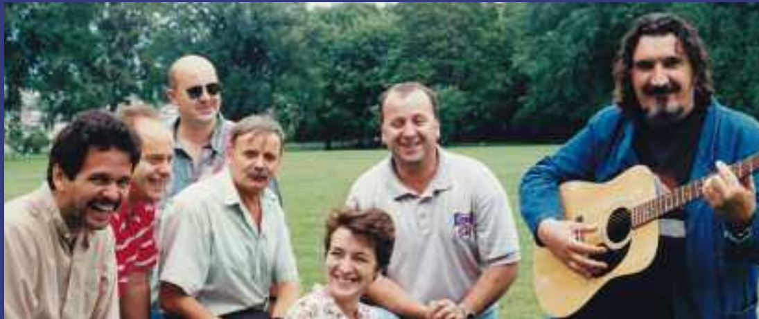
1996 – Épluchette de blé d'Inde