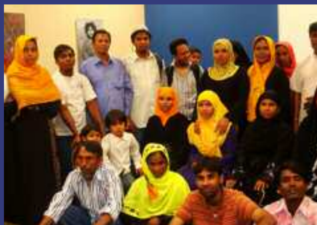
Intervention de groupe auprès des réfugiés rohingyas