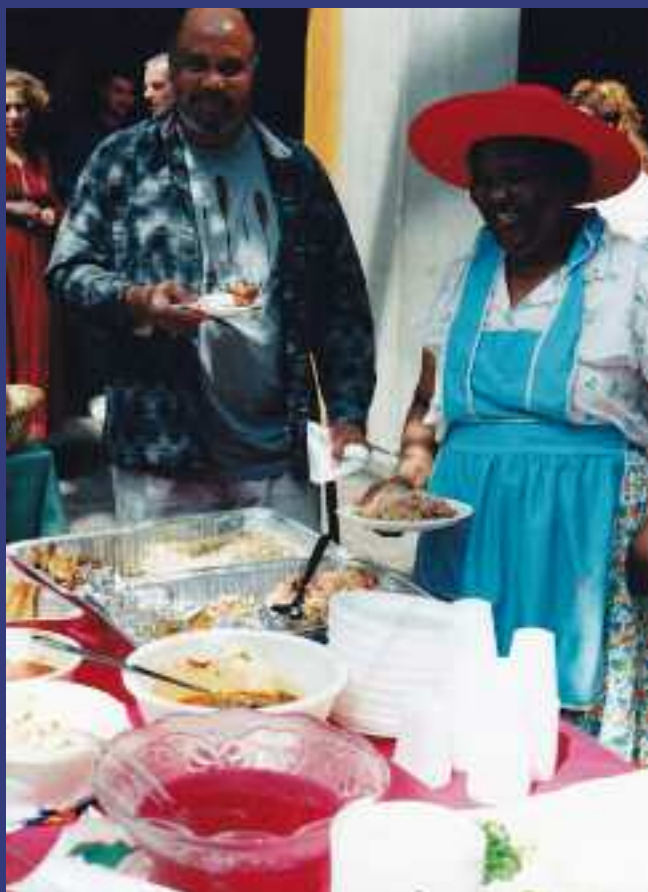
Kermesse gastronomique – Haïti

En mars 1980, La Fraternité canadienne de Québec inc. obtient une nouvelle charte et s'incorpore sous un nouveau nom, La fraternité multiculturelle de Québec inc. Sa mission évolue vers l'accueil et l'intégration des personnes immigrantes ainsi que la création de liens d'amitié entre les différentes ethnies et la communauté d'accueil. Un programme de jumelages est mis sur pied.