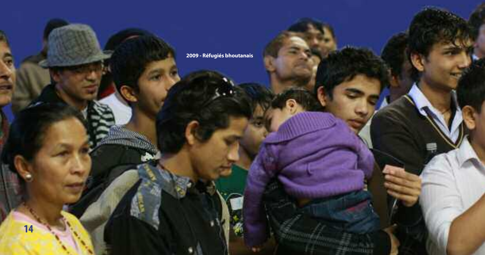
2009 - Réfugiés bhoutanais