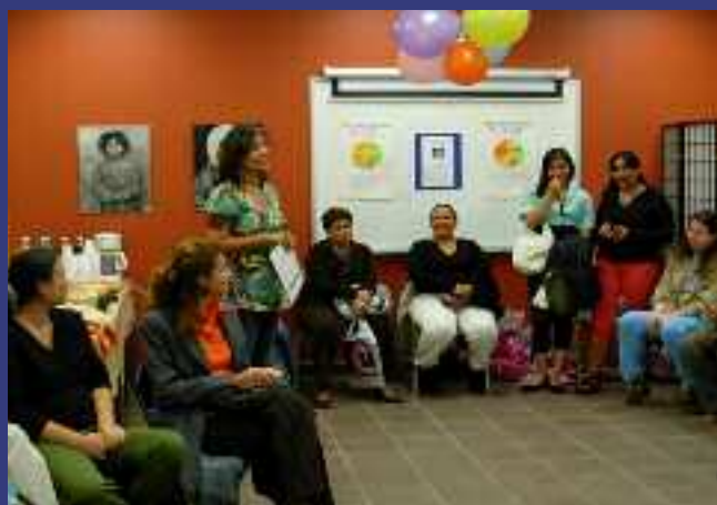
Groupe de femmes