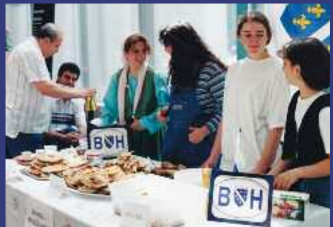
1995 – 35 ans CMQ

Le 12 octobre 1990, La fraternité multiculturelle de Québec inc. change de nom pour devenir le Centre multiethnique de Québec (CMQ). Membres et administrateurs sentent le besoin de redéfinir les objectifs en fonction des besoins variés grandissants d'une clientèle plus exigeante et de ce que la communauté d'accueil peut offrir. Un nouvel élan anime l'organisme.