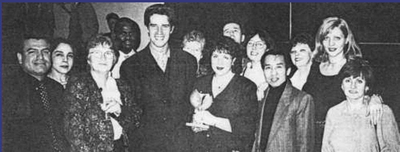
En 1996, le CMQ reçoit le prix du rapprochement interculturel remis par le ministre de l'Immigration et des Relations avec les citoyens à un organisme s'étant particulièrement distingué dans ce domaine.

Le Québec est maintenant l'unique responsable de la sélection, de l'Accueil et de l'intégration des personnes immigrantes sur son territoire; il confie au CMQ une partie des tâches d'accueil et d'accompagnement et le subventionne pour cela.