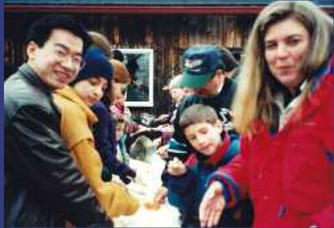
Cabane à sucre

Le financement se stabilise et provient du seul gouvernement du Québec. Les activités sont revues pour répondre aux besoins des nouveaux arrivants et de l'organisme. Ainsi, la Kermesse gastronomique internationale qui a réjoui deux générations de Québécois est abandonnée; l'organisme a d'autres sources de financement. Deux activités d'échange et de rapprochement