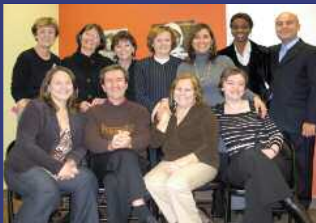
Équipe du CMQ avec 2 membres du CA