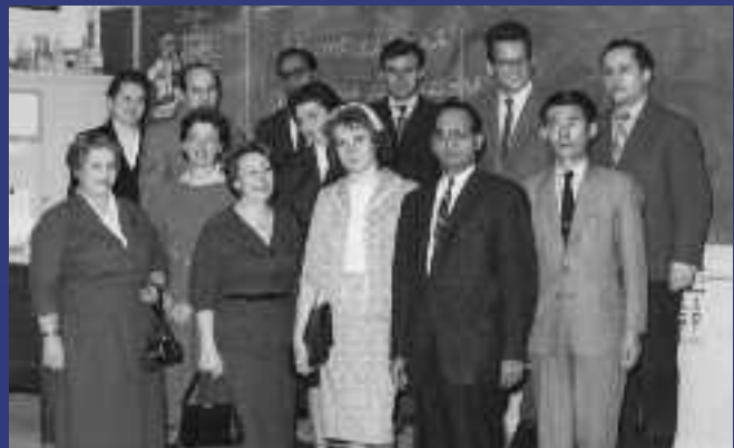
1961 - Cours de conversation française