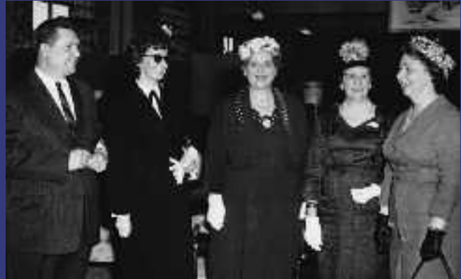
1961 - Conférence de presse - Kermesse gastronomique