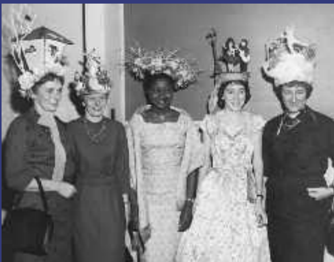
1961 - Bal des catherinettes