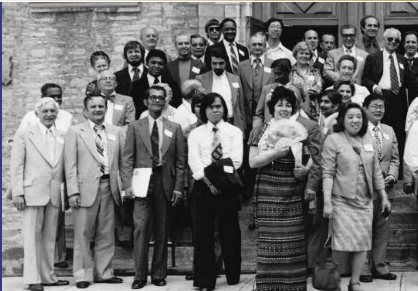
1976 – Rassemblement sur la Place Royale