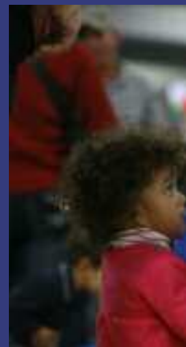
2009 - Fête de Noël

Par ailleurs, les échanges constants avec différents acteurs du milieu amènent une concertation débouchant sur des projets qui favorisent