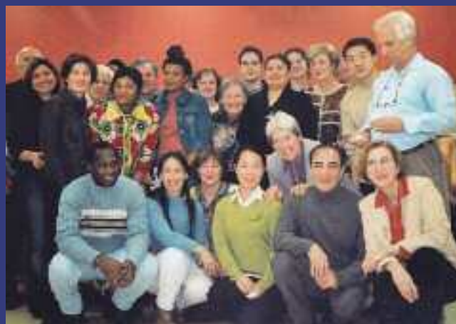
Bénévoles et Interprètes