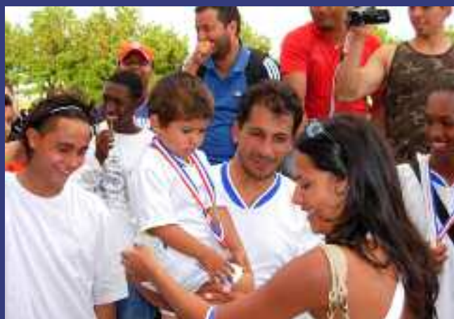
Tournoi de soccer