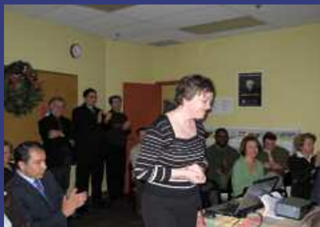
Lancement du site Internet