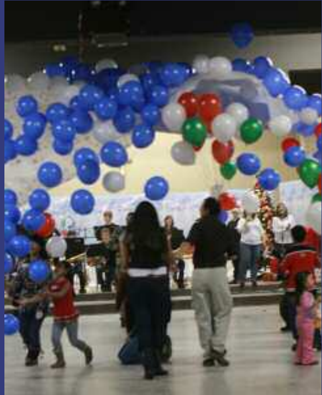
2009 – Lancement du 50e anniversaire

l'intervention dans les quartiers et les lieux d'intégration tels les commissions scolaires, les centres de loisirs, les parcs de logements. Deux projets chapeautés par le CMQ voient le jour : un intervenant pivot dans l'arrondissement Limoilou—de La Cité et un agent de liaison dans deux commissions scolaires.