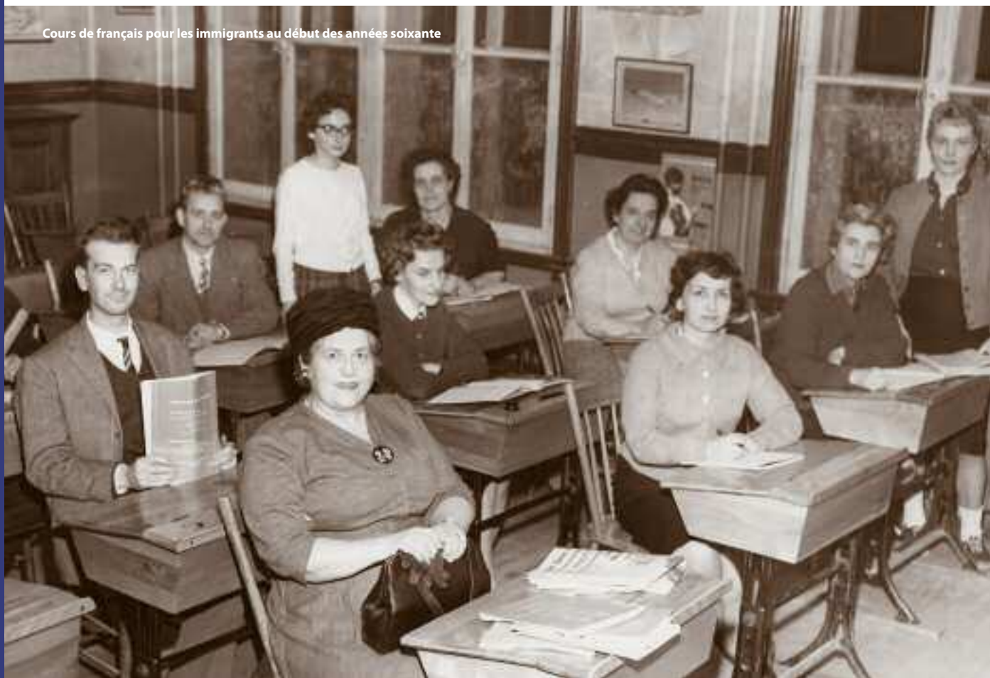
Cours de français pour les immigrants au début des années soixante

Recherche : Nabila Chermat Rédaction : Marie-Claude Gilles Correction : Marie-Claude Gilles et Charles-Henri Audet Conception graphique : IDFIX - Vincent Masson